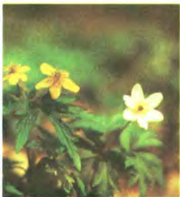
66. Анемона дібровна.